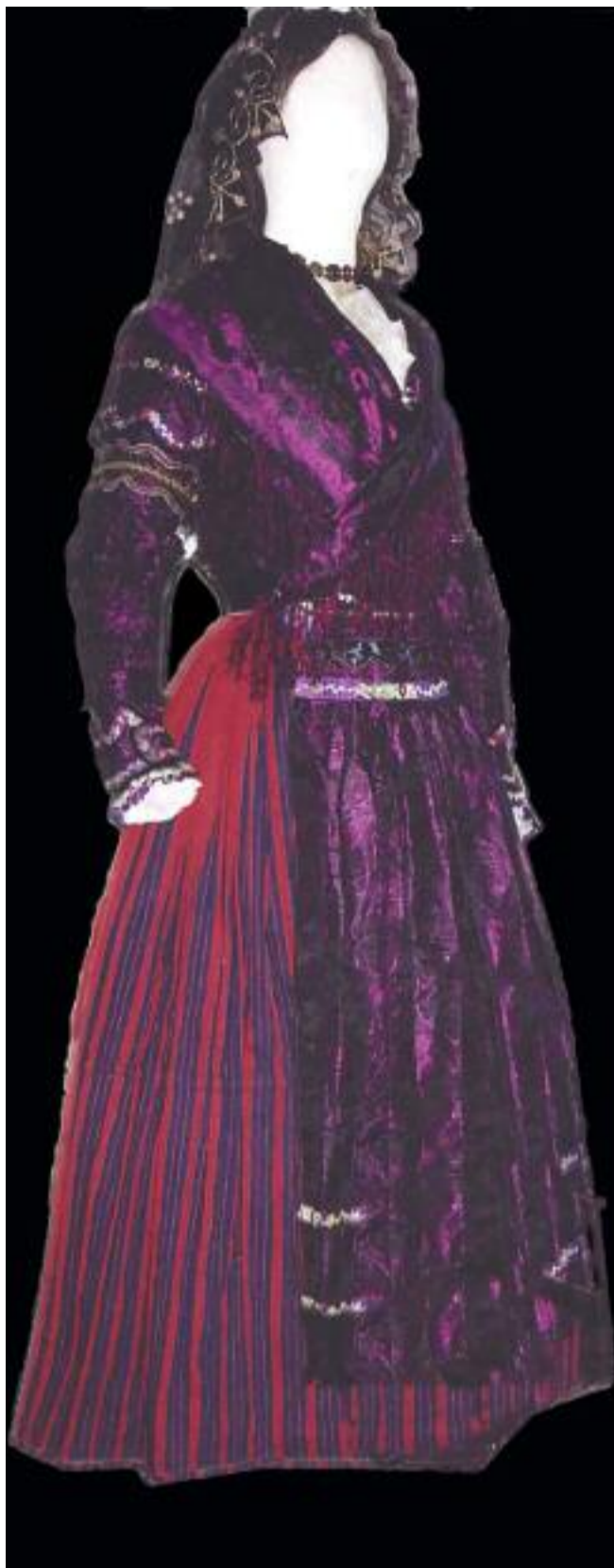
Costume de mariée sarde