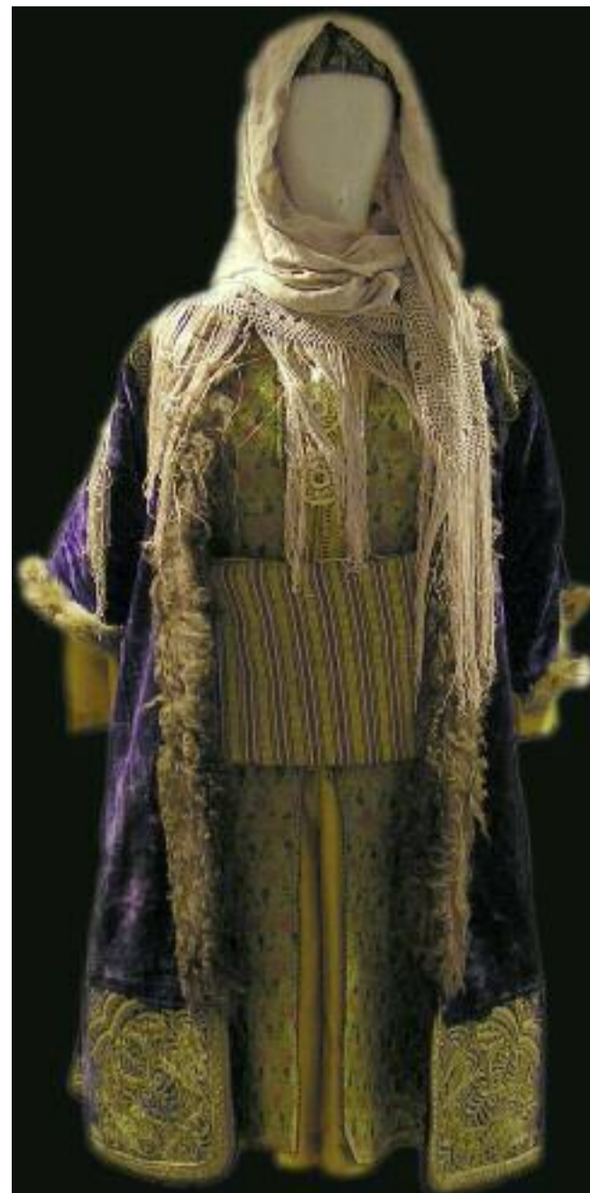
Costume de Kastellorizo