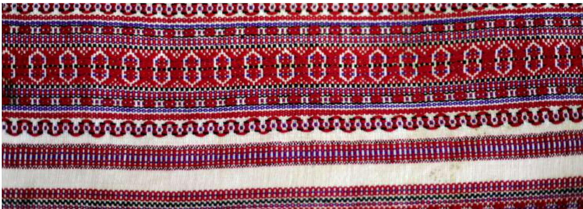
Détail de ceinture marocaine