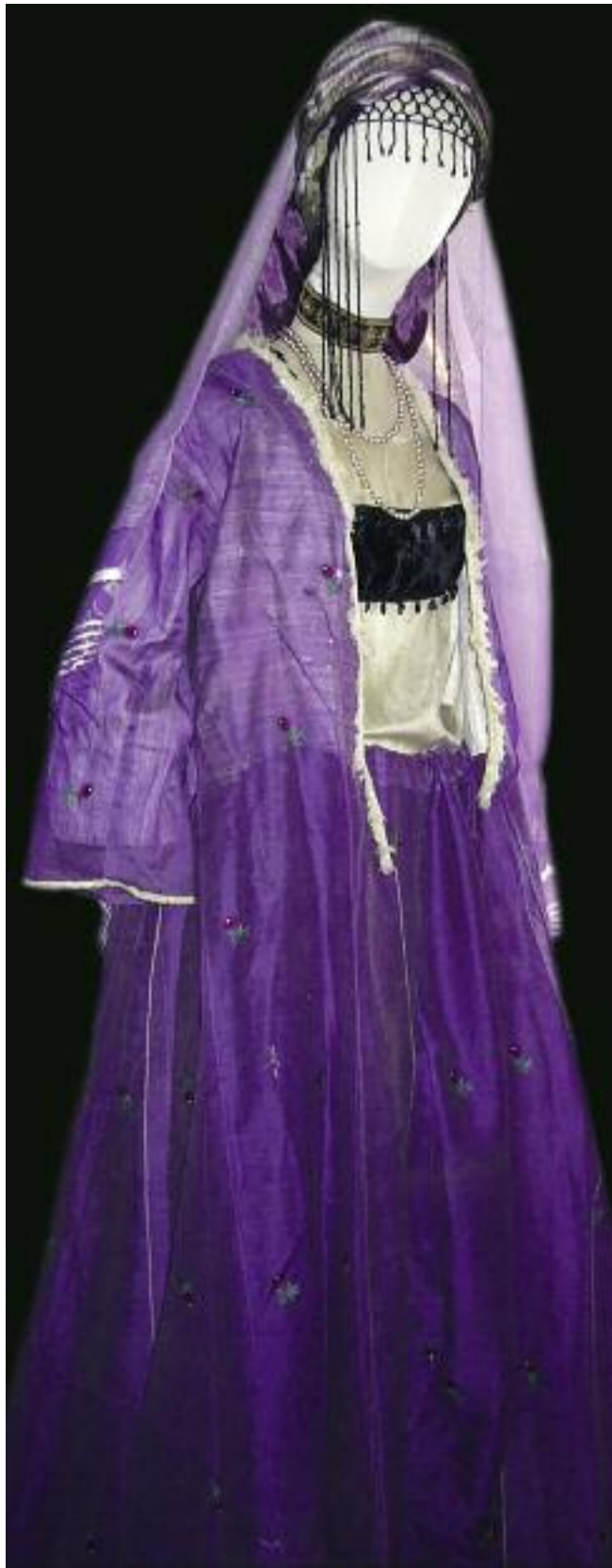
Costume ottoman de sortie de hammam