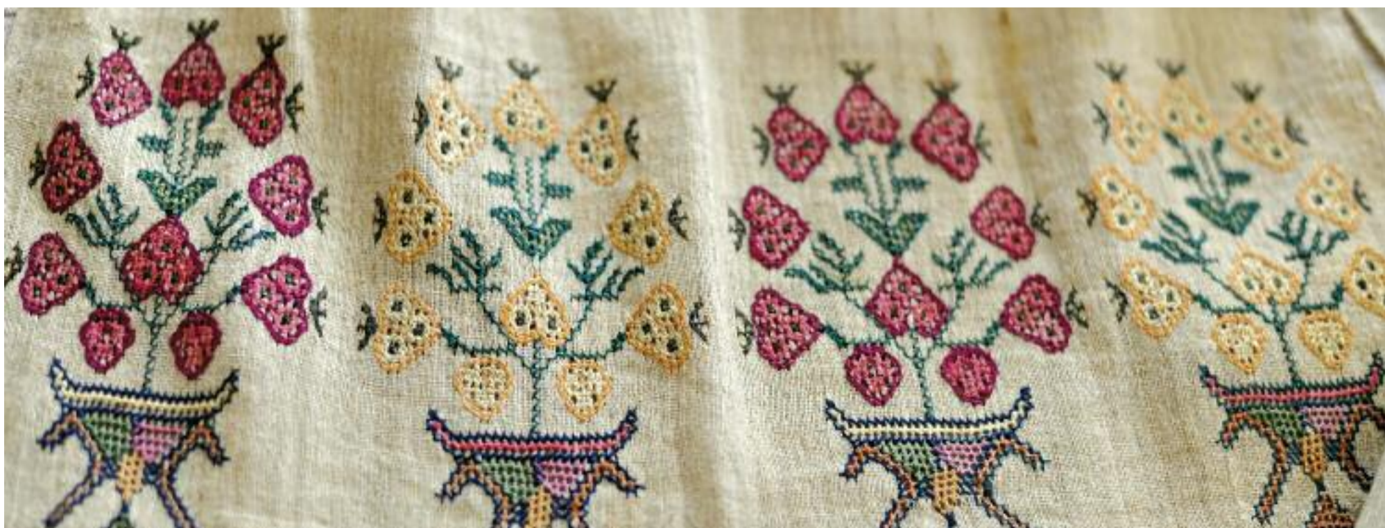
Détail de broderie marocaine