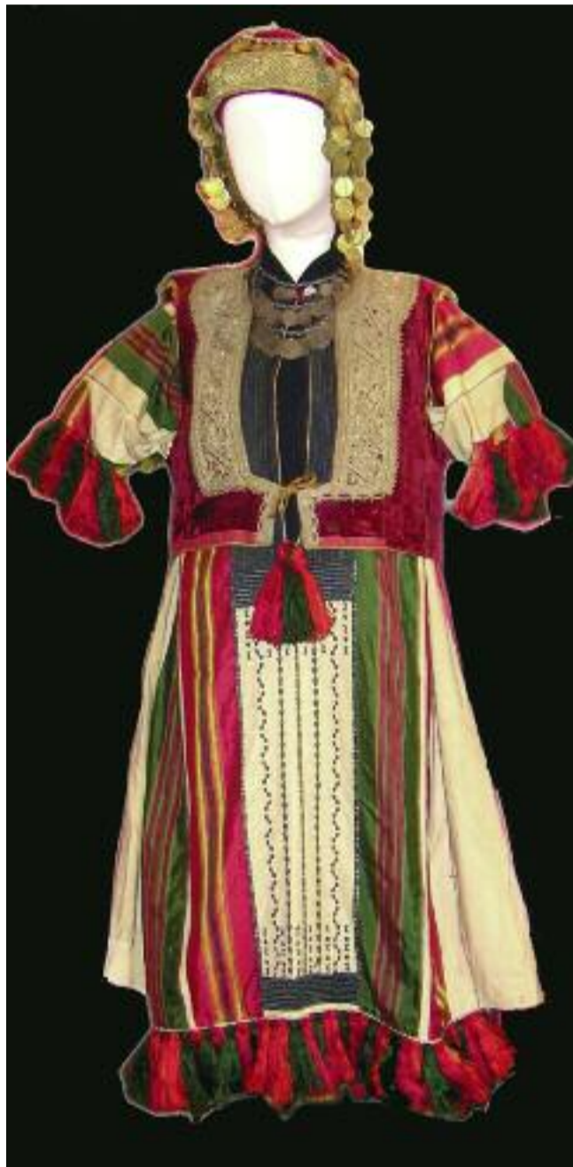
Costume tunisien de cérémonie