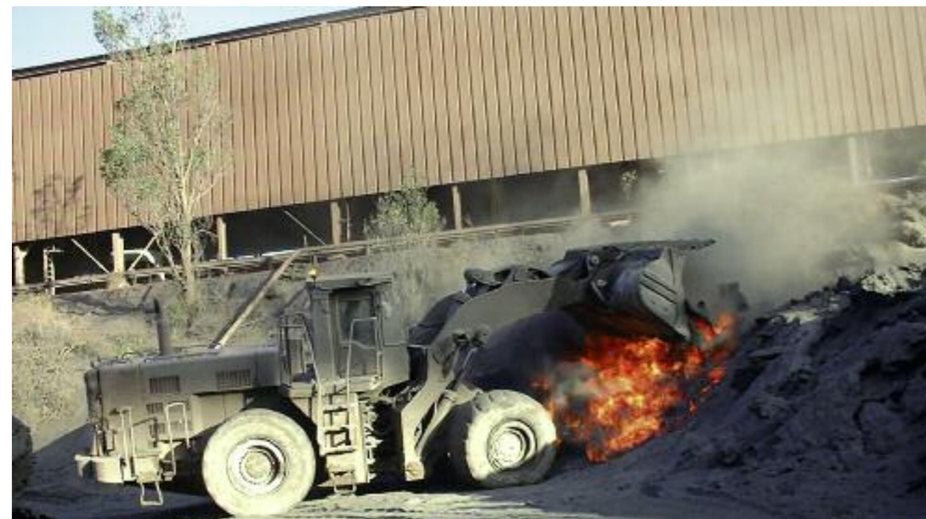
Texte A. Susanna

IL EST INACCEPTABLE QU'UN HOMME PUISSE AUJOURD'HUI MOURIR D'UNE MALADIE CAUSÉE PAR SES CONDITIONS DE TRAVAIL, DE LA MÊME FAÇON QU'UN MINEUR DE FOND POUVAIT MOURIR DE LA MALADIE DES POUMONS AU DÉBUT DU SIÈCLE.