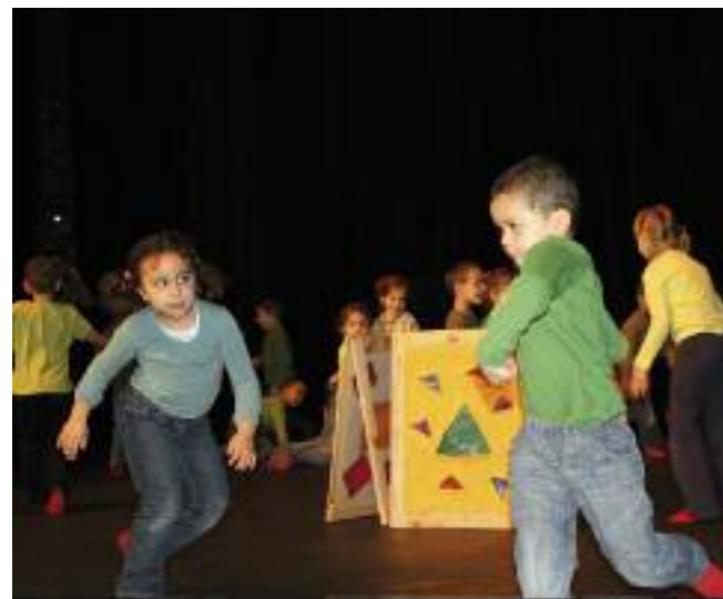
Texte/photo : C.Errera

Dans le cadre du projet pédagogique « Entrez dans la danse », proposé par le REP (réseau d'éducation prioritaire) en collaboration avec la compagnie Itinerrances, les enfants des grandes sections des maternelles Louise Michel et Marcel Pagnol et des CP d'Anatole France, étaient récemment en représentation danse au Sémaphore. Les spectateurs ont vivement applaudi tous ces petits « rats » pour leurs chorégraphies sur la scène des « grands ».