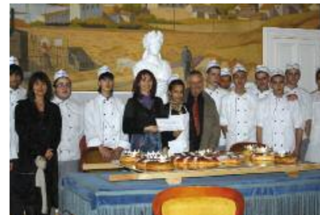
Texte/photo : C.Errera

Les apprentis du CFA Rol Tanguy en CAP pâtisserie-boulangerie ont offert à Mme le maire de délicieux gâteaux des rois réalisés dans le laboratoire de l'établissement. À cette occasion, les jeunes ont remis un chèque de 50 euros en faveur du peuple haïtien, victime du séisme. Cette somme a été récoltée grâce à la vente de viennoiseries et de pizzas qu'ils avaient confectionnées et vendues aux lycéens de Jean Moulin.