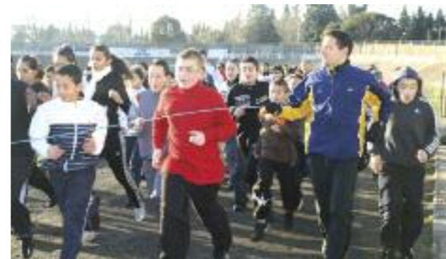
Texte/photo : C.Errera

Les professeurs de sport du collège Frédéric Mistral ont organisé leur traditionnel cross annuel au stade Baudillon qui a regroupé 360 collégiens. Par un froid sec sans vent, les jeunes ont fait leur maximum pour arriver en tête de l'épreuve.