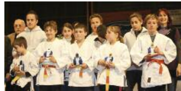
Texte/photo : C.Errera

Le gymnase Billoux était récemment le théâtre d'une soirée placée sous le signe du Fair-play et du respect. Des centaines de sportifs issus des clubs locaux étaient récompensés pour leurs résultats et leur esprit sportif.