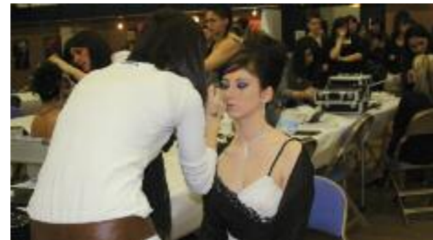
Texte/photo : C.Errera

La 4e édition de « Planète création », s'est déroulée dimanche 28 février à l'espace Gagarine et a comptabilisé quelques 800 entrées et 268 jeunes issus de 18 écoles. Le CFA Rol Tanguy a remporté, entre autres, le prix école dans la catégorie coiffure.