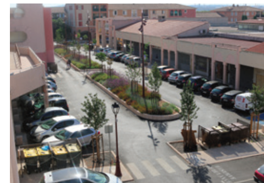
La galerie marchande de la Respélido, poursuit sa rénovation et accueillera de nouveaux commerces en 2019.

Au niveau du centre-ville, la zone marchande de la Respélido rentre dans sa dernière phase de rénovation. De nouveaux commerces vont ouvrir comme un primeur, un traiteur et une mercerie qui s'ajoutent à la récente ouverture du boucher, de la crêperie-snack, du magasin de cartes grises et accessoires auto et des deux boutiques de prêt-à-porter. « Les élus municipaux suivent de près le dossier de l'ancien Carrefour