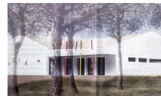
Vue 3D d'une façade de la future crèche

Ce projet repose sur un déplacement et une extension de l'actuel MAC Lucia Tichadou. Pourquoi ? Parce que si les subventions d'investissement permettent de réaliser une nouvelle crèche, la modestie du budget de fonctionnement communal ne permettrait pas une embauche suffisante en personnel. La Ville a donc fait le choix de transférer les 25 berceaux du MAC Tichadou (structure vieillissante) et son personnel, vers le nouvel établissement situé au chemin de la Draille.